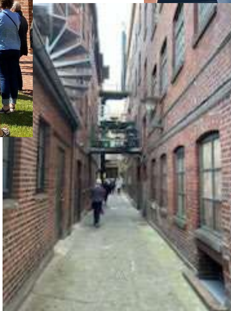
Lidt stemningsbilleder fra sidste byvandring i maj 2023